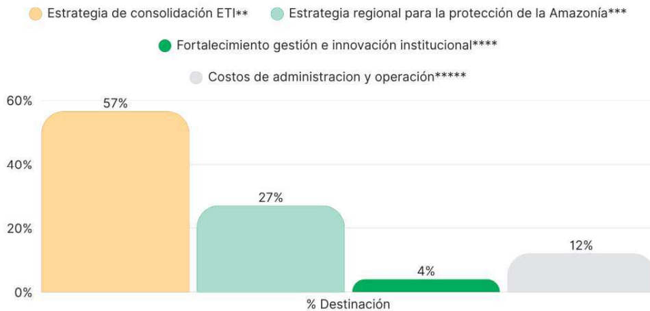
Gráfico. Distribución porcentual de la destinación de las subvenciones recibidas en 2025 por línea estratégica institucional.

Los recursos administrados por la Fundación Gaia Amazonas corresponden principalmente a subvenciones, convenios de cooperación y otros instrumentos de financiación con destinación específica, otorgados por entidades de cooperación internacional y organizaciones aliadas. En consecuencia, los valores reportados no representan ingresos de libre disposición, sino recursos comprometidos para la ejecución de programas y proyectos orientados al cumplimiento de la misión institucional. Durante la vigencia 2025, estos recursos se destinaron principalmente a tres líneas estratégicas: (i) consolidación de las Entidades Territoriales Indígenas de la Amazonía colombiana, mediante convenios Integral De Cooperación Política, Técnica, Administrativa, Y Financiera con 10 gobiernos indígenas de la Amazonía oriental colombiana para el fortalecimiento de su autonomía política, administrativa y fiscal); (ii) estrategia regional para la protección de la Amazonía; y (iii) fortalecimiento gestión e innovación institucional.